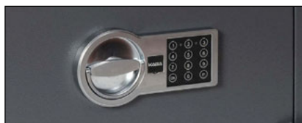
Elektronisches Tastenkombinationsschloss (VdS geprüft)