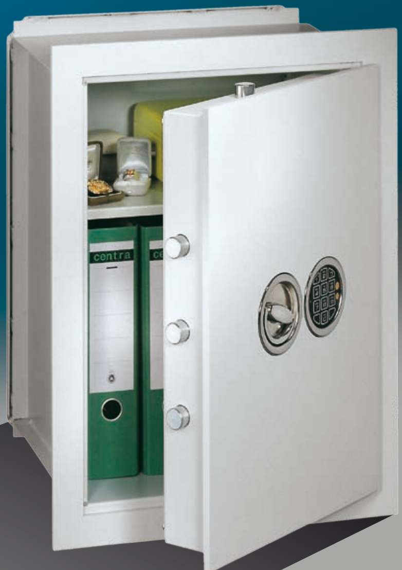
Abb.:VNO 6 (mit Sonderausstattung EZ LG Basic versenkt)