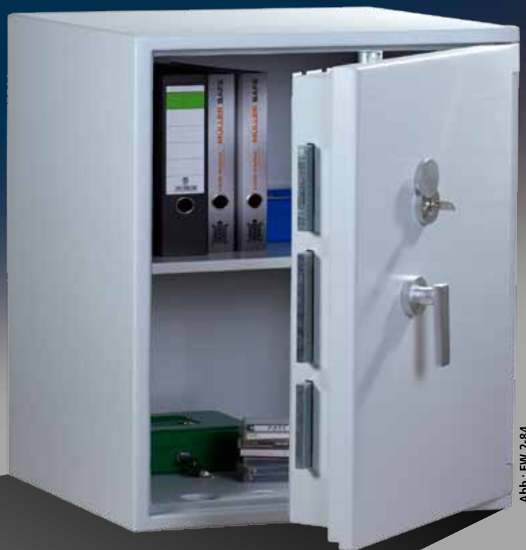
Abb.: EW 2-84