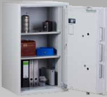
Abb.: EW 2-105