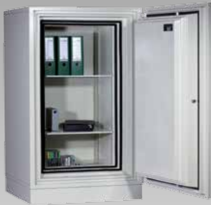
Abb.: DIS 40