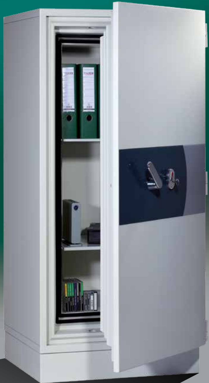
Abb.: DIS 40