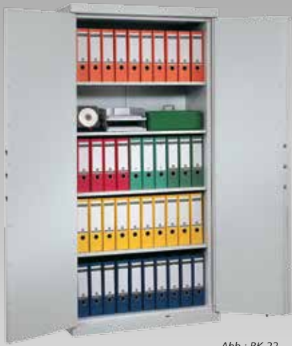
Abb.: BK 22