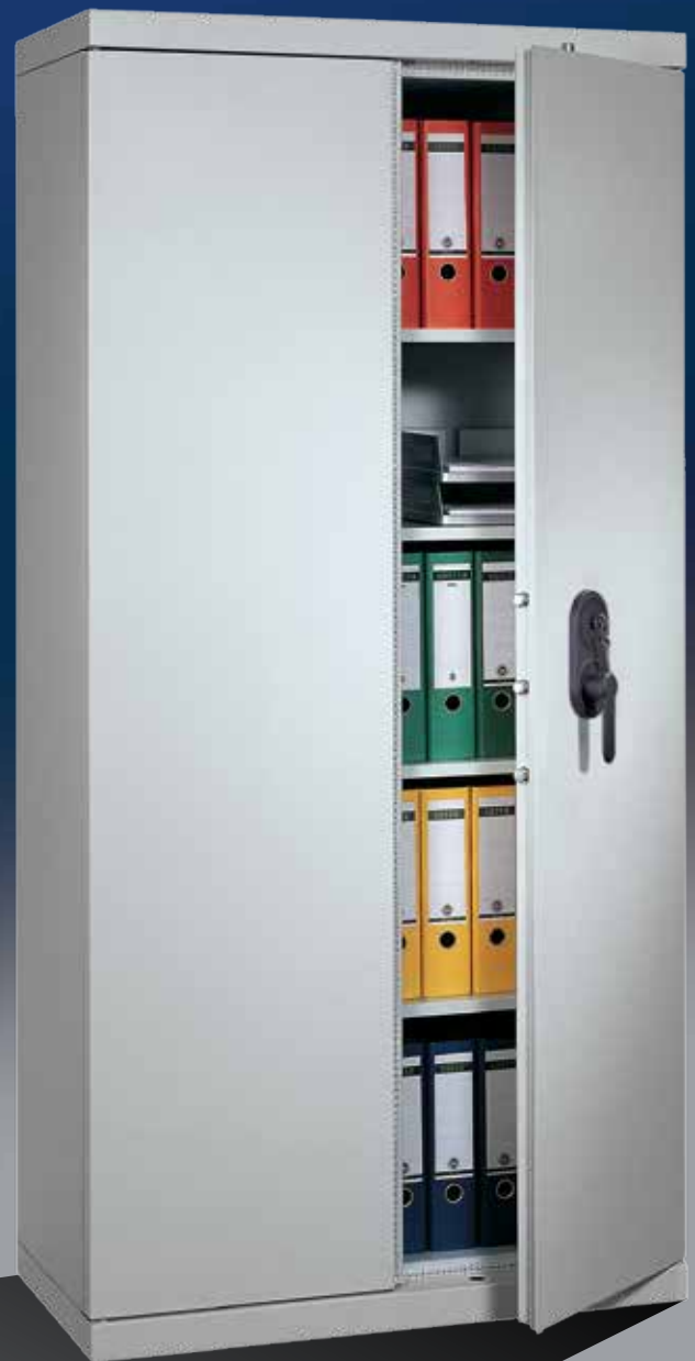
Abb.: BK 22