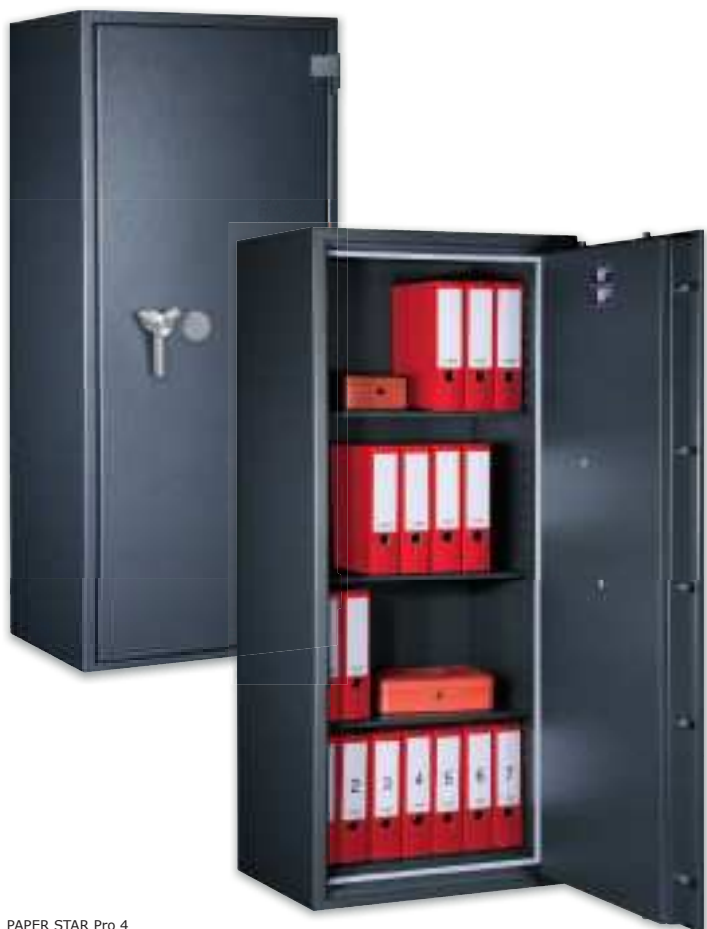
PAPER STAR Pro 4 Graphitgrau • graphite grey Dekoration nicht im Lieferumfang enthalten • decoration not included in the delivery

Datensicherungsschrank, S60P (EN 1047-1) / Grad I (EN 1143-1) Data protection cabinet, S60P (EN 1047-1) / Grade I (EN 1143-1)