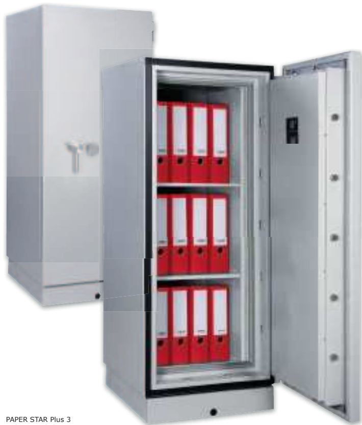
PAPER STAR Plus 3 Lichtgrau • light grey Dekoration nicht im Lieferumfang enthalten • decoration not included in the delivery

Datensicherungsschrank, S120P (EN 1047-1) / Grad I (EN 1143-1) Data protection safe, S120P (EN 1047-1) / Grade I (EN 1143-1)