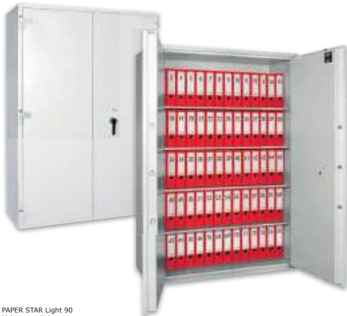
PAPER STAR Light 90 Lichtgrau • light grey

Brandschutzschrank, LFS30P (EN 15659) / S2 (EN 14450) Fire protection cabinet, LFS30P (EN 15659) / S2 (EN 14450)